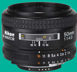
Nikon 50mm/1.4 G AF-S