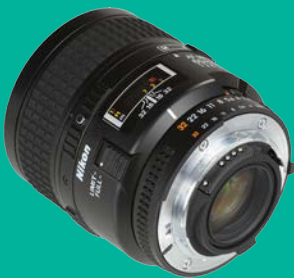
Nikon 60mm/2.8 D MC