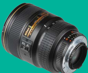
Nikon 17-35/2.8 ED