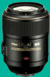
Nikon 105 F/2.8 micro AF-S VR ED