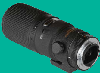
Nikon 200mm/4 AF D IF ED MC